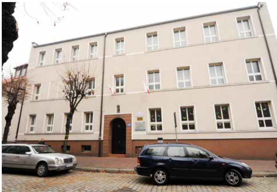
Niepubliczne Przedszkole im. siostry Włodzimiry Wojtczak w Ostrowie Wielkopolskim, działa od 2012 r.