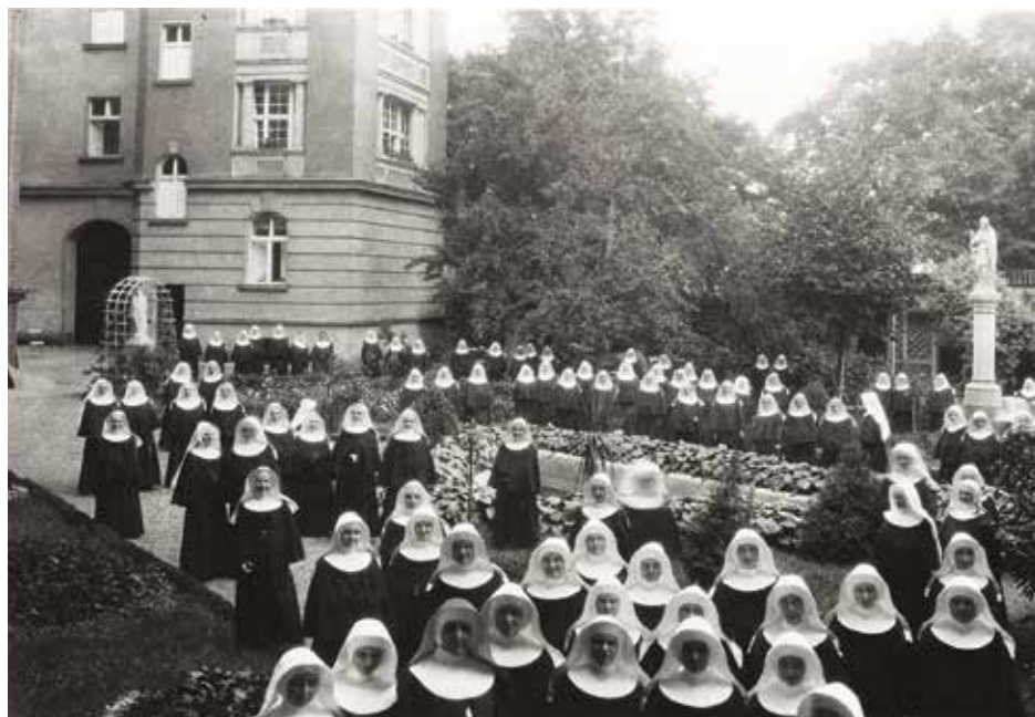
„Wymiana” Nowicjatu 1933 r.