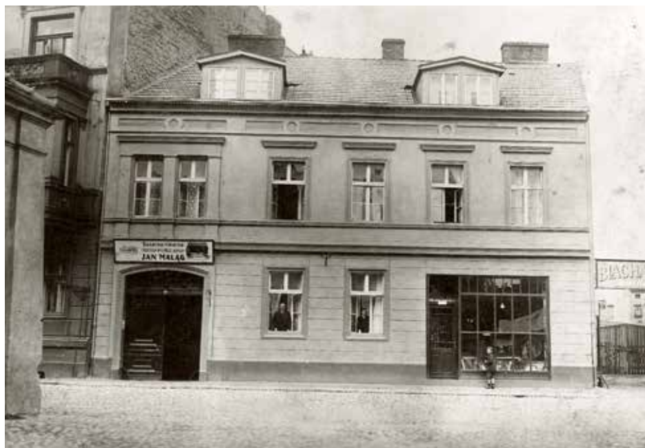
Dom Wojtczaków w Ostrowie Wlkp. przy Zielonym Rynku