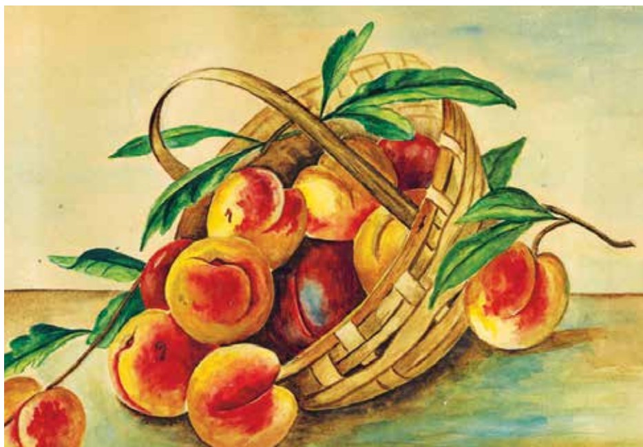
Obraz wykonany przez Czesławę Wojtczak w 1930 r.