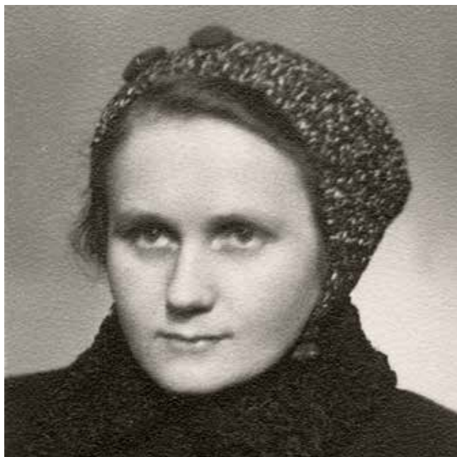
Siostra Włodzimira w czasie okupacji