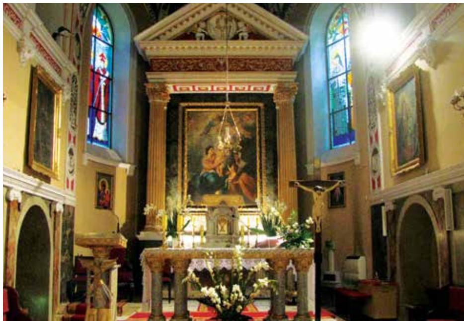
Ołtarz główny w kościele pw. ś. Wojciecha w Lewkowie