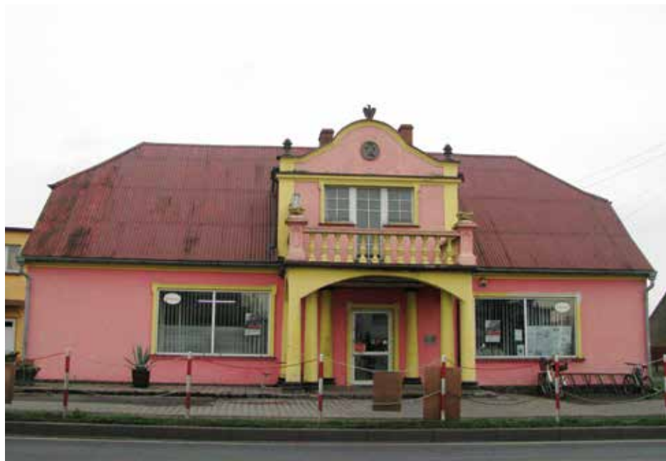
Dom we Franklinowie, w którym urodziła się siostra Włodzimira (wygląd współczesny)