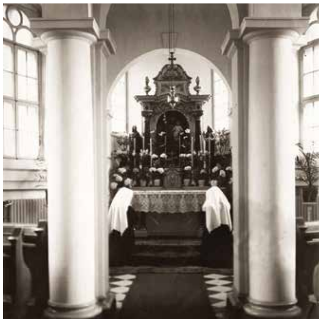
Przedwojenny ołtarz w kaplicy Domu Nowicjatu w Poznaniu ul. Łąkowa 4