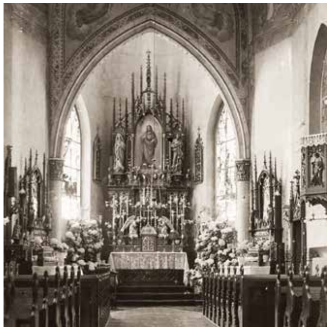
Przedwojenny ołtarz w kaplicy Domu Prowincjalnego w Poznaniu, ul. Łąkowa 1