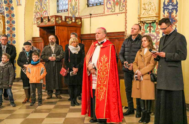
Droga krzyżowa ostrowskich środowisk twórczych w 2019 roku.