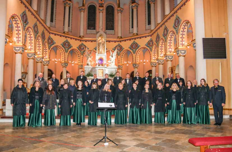
Fot. Ewa Kotowska-Rasiak